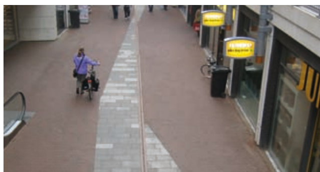
Papendrecht, W.C de Meent

De maatvoering van deze onderhoudselementen wordt vrijwel altijd per project afgestemd.