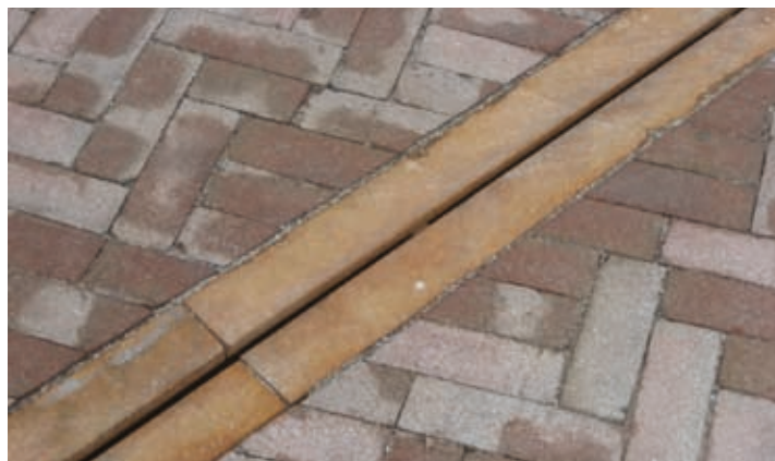
De Meent Papendrecht