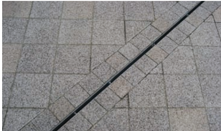
Smalle Haven Eindhoven