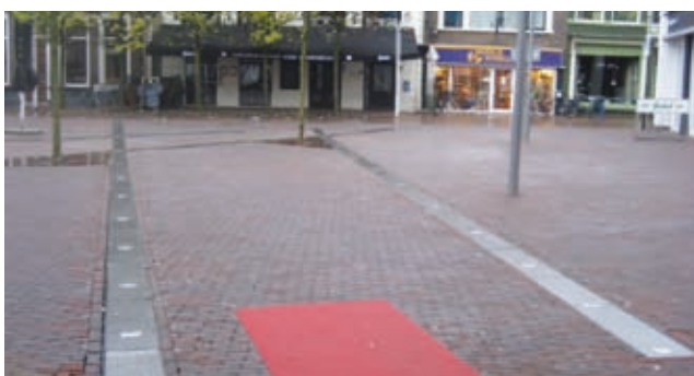
C. Amaliaplein Almelo

De maatvoering van deze onderhoudselementen wordt vrijwel altijd per project afgestemd.