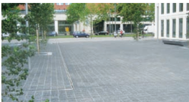
Rotterdam Kop van Zuid

De maatvoering van deze onderhoudselementen wordt vrijwel altijd per project afgestemd.