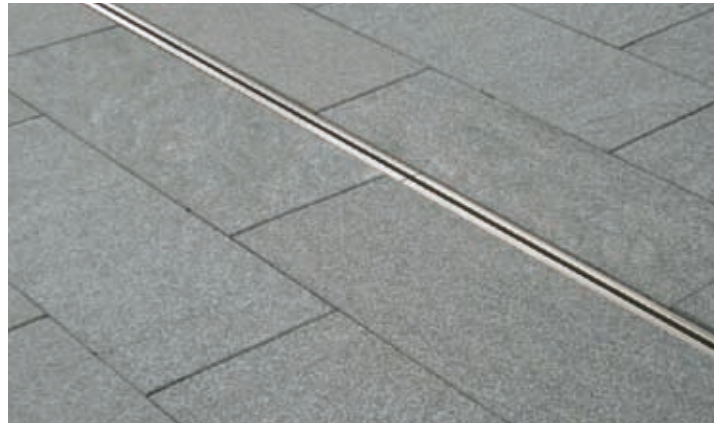
Terras Hotel New York Rotterdam