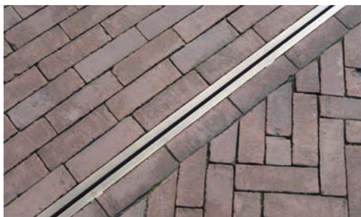
WC Oud Rijswijk